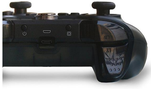
< 이전: 마이크로 5 핀 USB 단자 >

※ 본 업데이트는 신형(2018년 12월 이후 생산된 제품) 진동세기 조절용 펌웨어 업데이트입니다. 충전 케이블 단자의 외형 차이로 확인하실 수 있으며(신: C 타입, 구: 마이크로 5 핀), 2018년 12월 이전 제품은 다른 게시물을 확인하여 주시기 바랍니다.