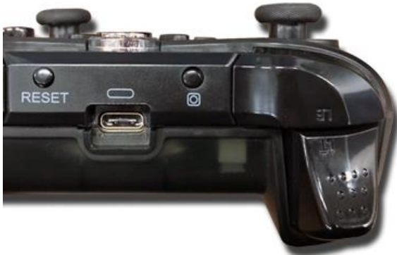
< 신형: C 타입 USB 단자 >